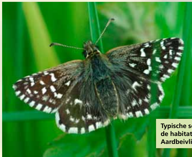
Adriaan Gmeiling Meyling

Van ongeveer één op de zes typische soorten worden de landelijke aantallen of de verspreiding gevolgd in het NEM. In veel gevallen is die informatie voldoende om de