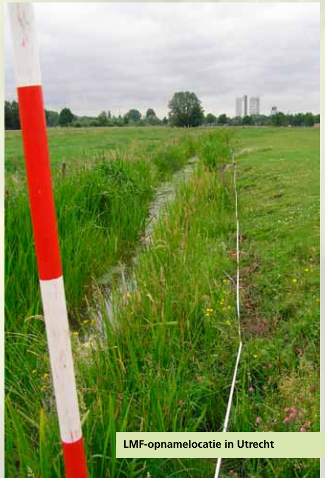
LMF-opnamelocatie in Utrecht

Het LMF omvat ongeveer 10.000 vaste meetpunten (permanente kwadraten, PQ's) waar eens per vier jaar de vegetatie wordt opgenomen. Het meetnet is primair opgezet om veranderingen in milieukwaliteit op landelijke schaal in de vegetatie te kunnen opsporen. De effecten van verzuring, verdroging, nutriëntenrijkdom en temperatuurverandering blijken inderdaad goed te bepalen. In sommige natuurtypen vinden we nu lichte afnamen van vooral verzuring. Voor verdroging en vermessing zien we hier en daar verbetering, maar soms ook verslechtering. Het meetnet blijkt dus in staat het gevoerde natuur- en milieubeleid op zijn effectiviteit te beoordelen. Diverse indicatoren hierover zijn op het Compendium van de Leefomgeving te vinden. Het meetnet is zo ontworpen dat niet alleen landelijke maar ook provinciale trends kunnen worden bepaald.